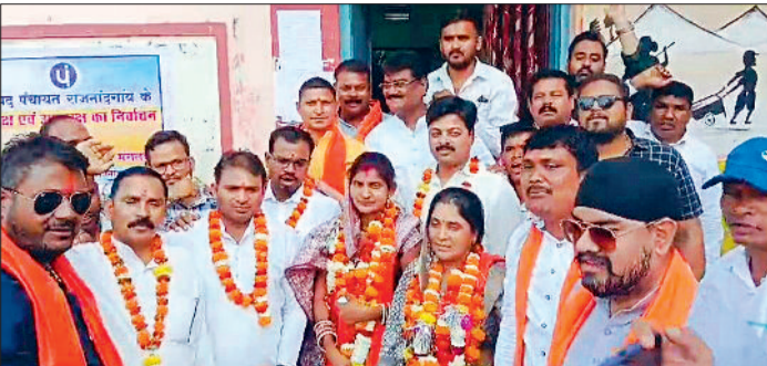
हरिभूमि न्यूज राजनांदगांव

25 सदस्यों वाले जनपद पंचायत में अध्यक्ष-उपाध्यक्ष पद को लेकर आज निर्वाचन की प्रक्रिया संपन्न हुई। इस दौरान 20 साल बाद भारतीय जनता पार्टी के समर्थित प्रत्याशियों ने दोनों ही पदों पर भाजपा संगठन की कुशल रणनीति के चलते अपनी जीत दर्ज करने में सफल रहे।